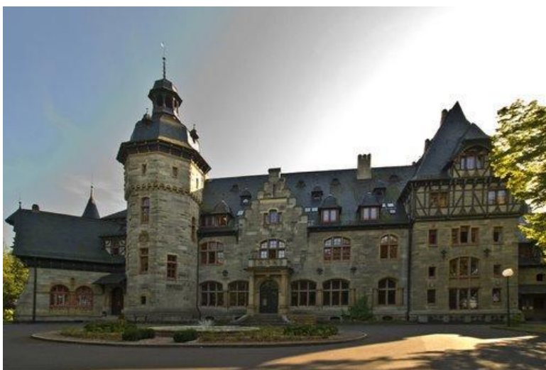
Villaen "Pflugensberg" i Eisenach, hvor Thüringens ev. luth. Kirkes centrale forvaltning har haft til huse siden 1921. Her havde også landsbiskopperne deres embedsbolig.